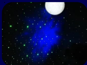
Vue de l'espace sur scène